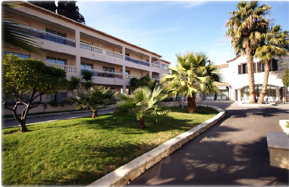
Etablissement privé Médica France

73, rue du Plateau Calliste 06700 Saint Laurent du Var